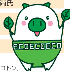
福岡県マスコット キャラクター「エコトン」