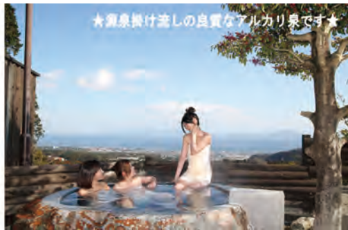
★源泉掛け流しの良質なアルカリ泉です★

☆2020年2月時点の料金です。 ☆フェリー代、有料道路代は別途ご負担をお願いします。 ☆ご夕食はビュッフェとなっております。 ☆夕食ビュッフェは飲み放題付きです。