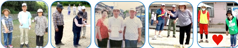
↑大池寿会D ↑弥生若生会C ↑城ヶ崎つくし会A ↑最高齢者賞下鶴様 仲良し夫婦賞