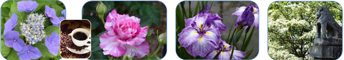
左から) 直方市もととり/紫陽花、八幡本城緑地/薔薇、みやこ町豊津/花菖蒲、右端は芦屋町岡湊神社の？

コーヒータイム；紙上花美展 * 野に山に花 花 花 盛り (筆者撮影) * 右下の「花の名前」ご存じですか？