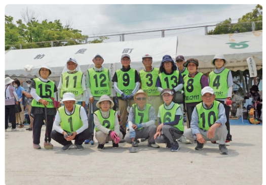
持てる力を発揮して頑張った 若杉クラブ選手の皆さん

開会式は9時に始まり、郡シニ会长挨拶、前年度優勝杯返還、競技上の注意。いよいよ、3コース、24ストロークプレーによる競技開始です。競技では個人戦、団体戦の優勝を目指して熱戦が繰り広げられました。