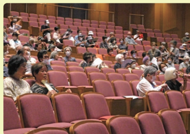
アザレア大ホールの客席2階の参加者(第2回高齢者学級)