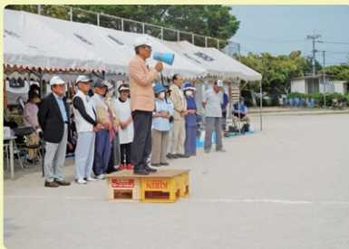
開会挨拶をする因郡シ連会長と整列する幹部の皆さん(郡シ連GG大会)