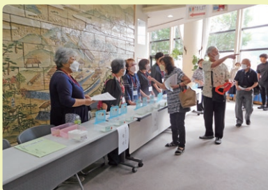
参加者と挨拶を交わす受付担当の女性部の皆さん(第2回高齢者学級)