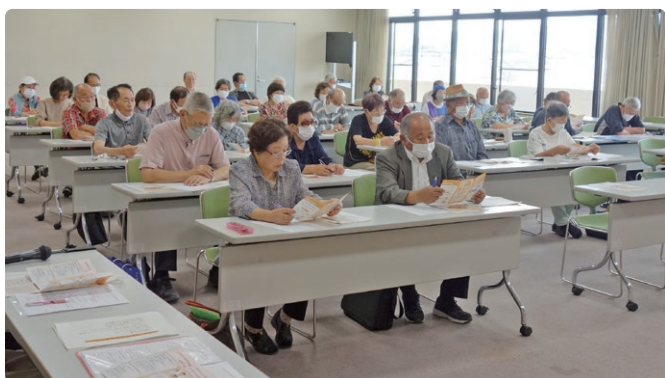
単位クラブ会長と女性部長が並んで熱心に説明を聞きました。

規事業として、女性部を中心として取り組んでいる高齢者相互支援活動員に対して「須恵町福祉課及び須恵町地域包括支援センター事業（以下支援事業）の理解を深め、そのことを支援対象者に伝える力を持つ研修」を行うとしています。この研修の一つとして、若杉クラブ女性部が執行部、単位クラブ会長、単位クラブ女性部長を対象とした研修会を、6月22日（木）、アザレアホール須恵3階大会議室で開催しました。