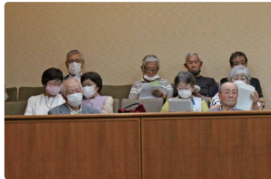
熱心に傍聴する若杉クラブ参加者

問をするのか、どんな疑問を持っているのか、想像しただけでワクワクします。実現すると思います。その時はぜひ傍聴したいと思いました。