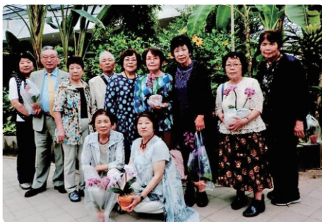
アイランドシティ植物園体験学習 施設「グリングリン」にて

毎年植物園等への日帰り研修旅行を行っていましたが、ここ数年コロナ禍で実施できませんでしたが、今秋11月には若松響灘緑地グリーンパークへの研修旅行を計画しています。園芸部に興味のある方のご参加も歓迎します。ご一報下さい。