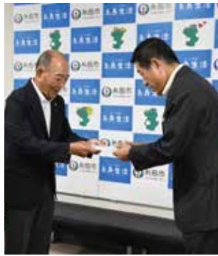
里村会長より手渡し

糸島市シニアクラブ連合会は、九州北部豪雨での被災者を支援しようと7月の理事会で協議し、義援金を募ることを決定いたしました。各校区の単位クラブを通じ、会員から寄せられた義援金を9月