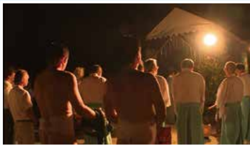
お汐井取りの様子

9月20日(水)、 本村・松井シニア クラブで社会奉仕 作業を実施しまし た。小中学生の通 学路の除草作業で す。