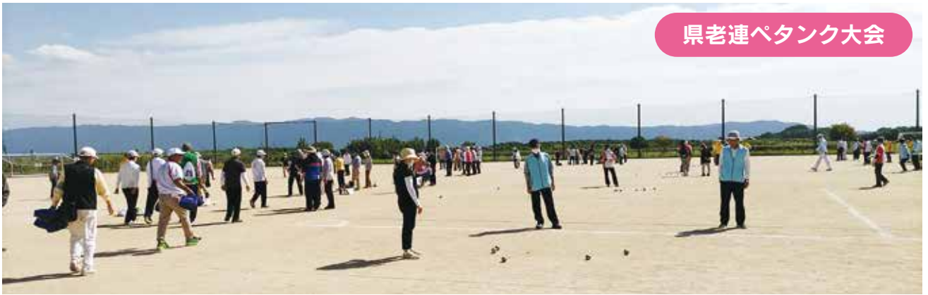
県老連ペタンク大会