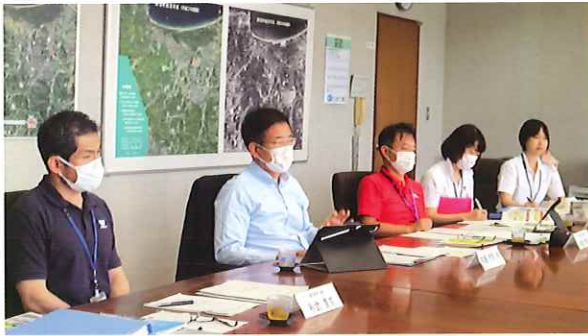
門司町長ほか担当課の出席者