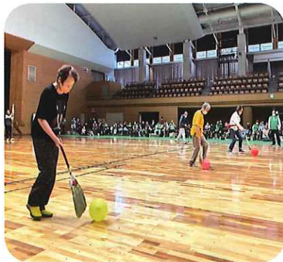
掃除リレー 84名参加