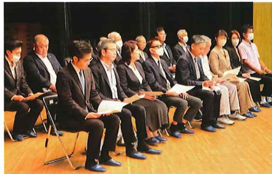
開会式に出席の来賓の皆様

10月13日(金) サンアリーナ ウェブアリーナで高齢者スポーツ大会が開催されました。参加者357名。午前10時に開会、式典・健康講演・昼食後13時から競技を開始しました。感染症対策も考慮して競技種目を減らして実施されました。