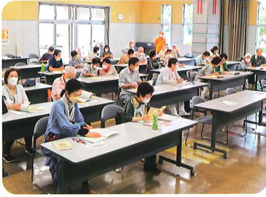
高齢者相互支援活動員研修会 (1日目)