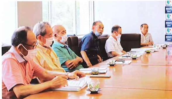
岡垣町寿会連合会の会長ほか役員

7月11日、町長と岡垣町寿会連合会との懇談会が行われました。この懇談会は寿会の健全な発展と相互理解を図るために例年実施されているものです。懇談にあたって次のようなテーマが設定され話し合われました。「高齢者が住みやすく住み続けたい町