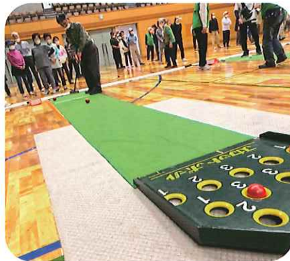
スカットボール (72名参加)