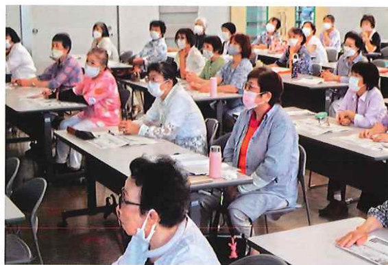
熱心に受講する女性リーダーのみなさん