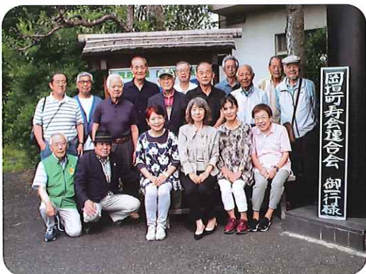
2日目 出発前 桑之屋玄関前

感染症の心配からか参加者が少なかったようです。しかし、その分参加者の交流は広く深くできたように感じました。来年はもっと多くの会長さん方の参加をお願いします。