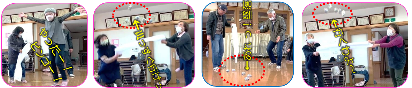
お手玉5個を載せたタオルの両端を持って、息を合わせて的に向かってホーイ。楽しかった～

10/21 270回 サロン夢塾（参加22名） スポーツの秋 健康づくり 息を合わせて お手玉ホーイ