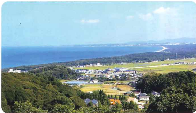
成田山から見た三里松原