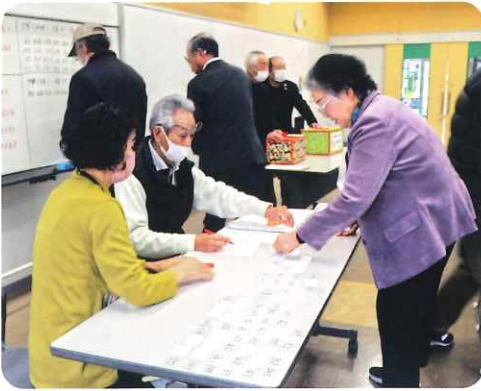
抽選会場 「慎重に、慎重に」