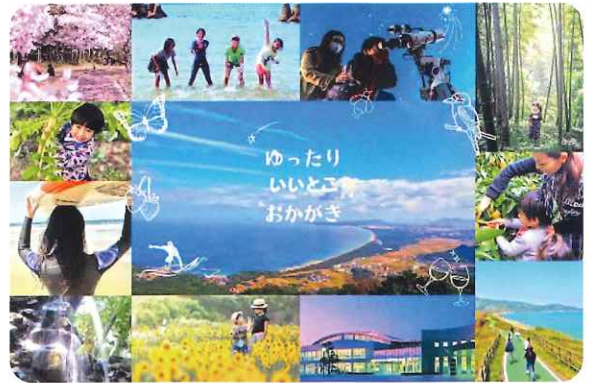
岡垣町のブランドテーマのイメージ