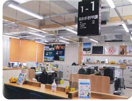
役場1階ロビー 入口左側 「おかがきPR課」の窓口

岡垣町に長く住んでいると役場に足をはこぶ機会が増えます。それでも自分の目的の窓口にしかが眼がいかないものです。町役場に入つてすぐ左側には広い談話スペースがありました。その場所に2年前「おかがきPR課」が新設されました。寿会連合会の会員の皆様向けに「ねんりん」編集部がおかがきPR課のPRをがって出たわけです。課で資料を頂き再構成しました。