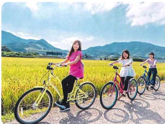
稲穂を見ながらサイクリング