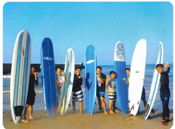
波津でサーフィン体験