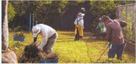
シーパーク公園 草刈り・清掃活動

活動している単位クラブを紹介いたしますと、福吉校区の中心部に位置する吉井下単位クラブは、5年前から「誕生日プレゼント」を全員に渡しています