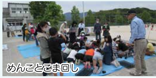
めんことこま回し

荻浦 多久、南風台、美咲が丘の4単位クラブで構成し、南風校区運営委員会構成団体として校区内の