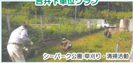
吉井下単位クラブ

福吉校区は人口約4000人で、6行政区があります。そのうち半分の3行政区が単位クラブ活動を実施しています。校区の特徴は、東西に長く距離12キロ以上あり、大入・福吉・鹿家とJR3つの駅が点在します。また、山や海と自然に囲まれ風光明媚な場所に位置します。