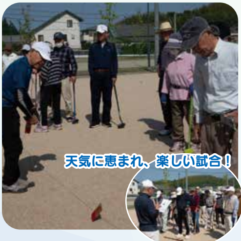
天気に恵まれ、楽しい試合!

11単位クラブで構成し、雷山校区行事としてグラウンドゴルフ大会、小学校との連携で昔あそびや花苗の植栽(ひまわり・牡丹など)、講演会(社協と交互開催)、バス日帰り研修会などを実施しています。今回は今年度実施した、グラウンドゴルフ大会を紹介いたします。 令和6年5月10日(金) 雷寿会グラウンドゴルフ大会を糸島市運動公園で開催しました。