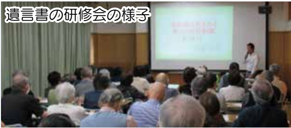
遺言書の研修会の様子