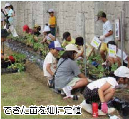
できた苗を畑に定植

南風小学校とは、1年生を対象としたプログラム「冬と仲よし」(旧昔遊び)では、寒い季節ですがあやとりやこま回し、竹とんぼなど会員の得意な種目のコツを伝授しながら、童心に返り楽しんでい