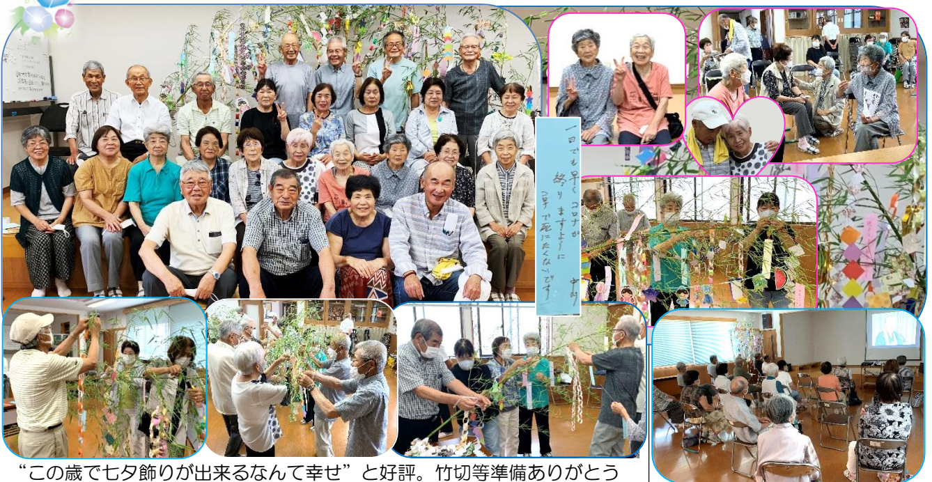
“この歳で七夕飾りが出来るなんて幸せ”と好評。竹切等準備ありがとう

7/11 第238回定例サロン*参加者；29名 短冊に願いごとを書きました。一瞬 マスクを外し記念写真