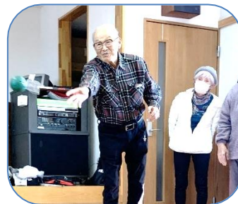
定例サロンと 夢塾サロンと 役員会は毎月1回。健康づくりにGゴルフは毎日