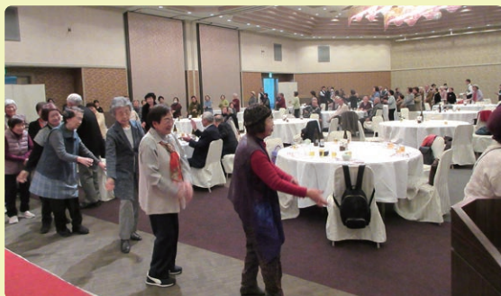
懇親会の終わりにみんなで炭坑節の総踊り