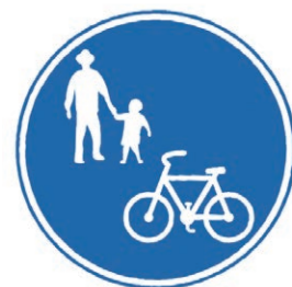
自転車歩道通行可標識