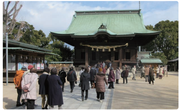
参拝をされる会員の皆様