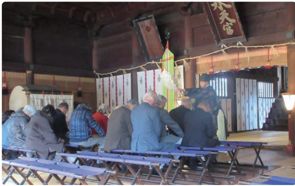
正式参拝の本部役員と理事のみなさん