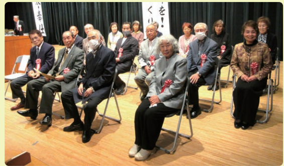
退任される単位クラブ会長・女性部長の皆様