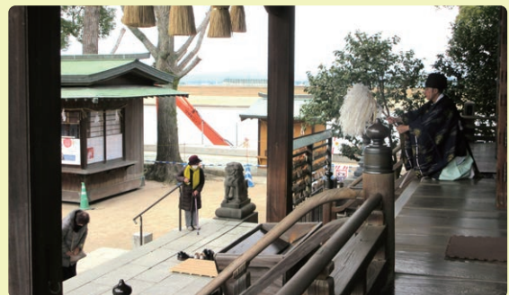
参拝者の皆さんに、お祓いをされる神主様