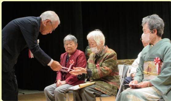
長寿者・金婚者の皆さんへ記念品の贈呈