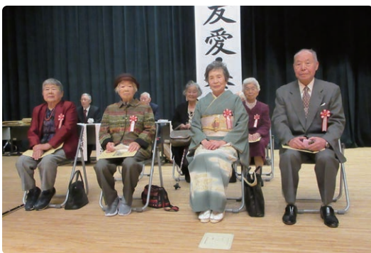
長寿者・金婚者への記念品贈呈式 に出席された皆様