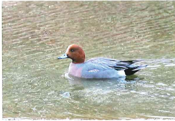
ヒドリガモ(緋鳥鴨) 全長53cm

西郷川で見られる野鳥の紹介です。第31号で紹介したカワセミ、ヒクイナ、ヨシゴイに続き今回は西郷川で初めて確認したヒドリガモ、まれに姿を見せるオシドリとクイナの3羽を紹介します。