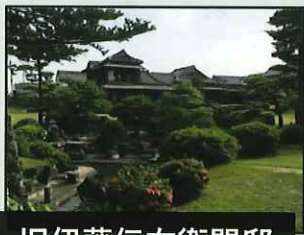
旧伊藤伝右衛門邸

昨年度、しののめ会は万全のコロナ感染防止策を講じつつ左の図にある県内各地を散策しました。今年も行きます。なお公民館でも色々な文化活動を行っております。