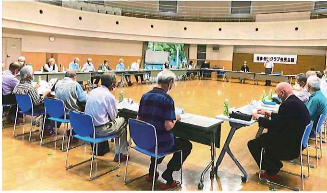
理事・単位クラブ会長会議の様様

五月三十日(月)ふくとびあ「健康プラザ」で、理事・単位クラブ会長会議が開催されました。令和四年度最初の会議で、役員改選により半数近くが交代しましたので、会議は、自己紹介からはじまりました。 そして、執行部から年間行事について説明があり、諸行事への積極的な参加と、重点項目である会員増強への取り組みについて要請がありました。