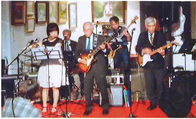
佐賀のホテルでの演奏会（右端 筆者）

毎月、佐賀のホテルで演奏会を行い、その他にも会社の慰安会や結婚披露宴に呼ばれています。光陽台の夏祭りや敬老の日での演奏をバンド全員楽しみにしています。