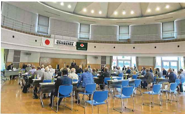
福津市シニアクラブ連合会総会の様子

それでは、「人生に今さらはない、今から、今から」の気概をもって、今後も皆様が、元気に人生を謳歌しながら、活動にお励みください。祝辞を結びます。