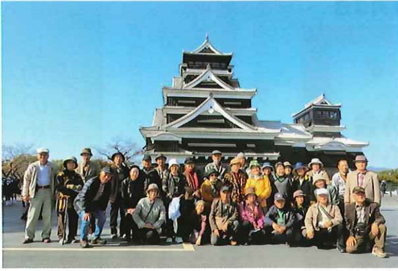
熊本城にて全員で記念撮影しました！

コロナ禍で遠出が出来ない期間からやっと解放され、2年ぶりにバスハイクが開催されることになりました。当日は快晴の旅行日和となった11月17日(水)の朝8時に四角公民館前を宗像観光バスで、32名の会員は赤羽シニアクラブ会長の案内ガイドを聞きながら、一路目的地の熊本城を目指して出発しました。途中基山パークや、北熊本パーキングでもトイレ休憩をし、10時40分に無事熊本城に到着しました。