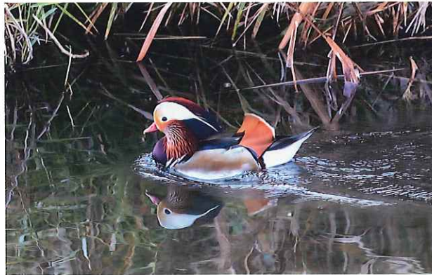
オシドリ(鴛鴦) 全長48cm

北海道、本州、九州で普通に繁殖する。福津市内の里山の周辺の池では冬から春にかけてよく見られる。西郷川にも単独か数羽が姿を見せる。