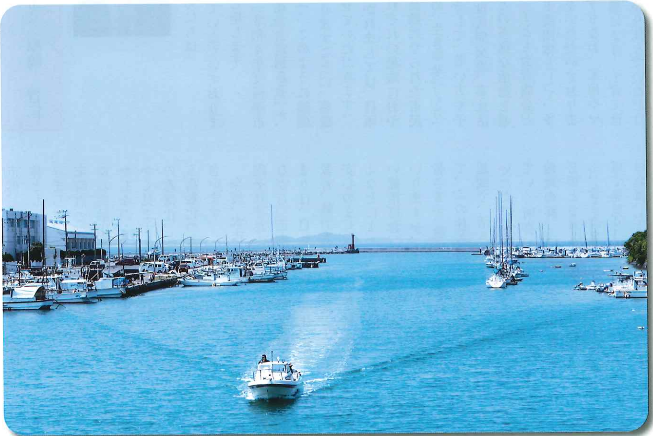
津屋崎漁港 津屋崎橋からの展望