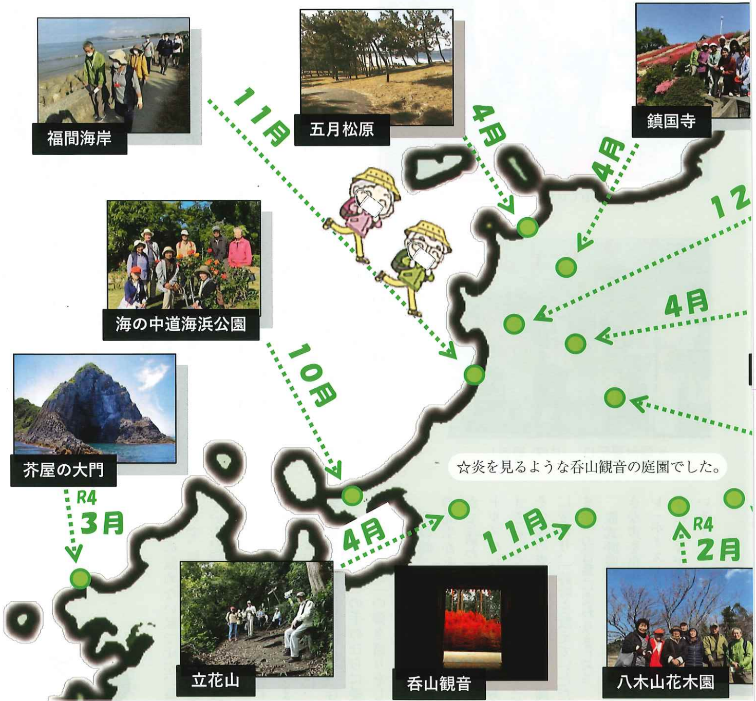
☆立花山 登山口に咲いていた花がとてもきれいでした。

住みなれたまちで安心して暮らすための お手伝いを致します。お気軽にご相談下さい。