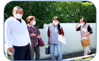
②；鞍手中生徒の演奏会の様子 ③；広報宅配で見守り活動