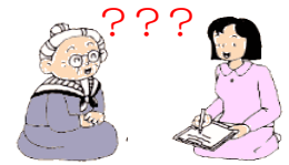
認知症とは、脳の 働きが障害をうけた 状態で、日本の認知 症は240万人超に

要介護度別にみると、要支援者では「関節疾 患」が18.9%で最も多く、次いで「高齢によ る衰弱」が16.1%となっている。要介護者 では「認知症」が24.3%で最も多く、次いで「 脳血管疾患」(脳卒中)が19.2%である。 (厚労省資料)