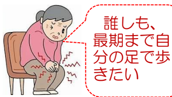
寝込んだら 認知症が心配です

*今より1000歩(約10分多く歩く) * ラジオ体操など行う *意識して 階段の昇り降りを行う *清掃など意識してテキパキと行う *買い物は荷物を持って歩く *駐車場は目的地の遠くに置く *事例発表4件と意見交換。*町老連が目指す「高齢者が元気な街」「健康寿命延伸」に挑戦しましょう