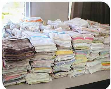
束ねたぞうきんの山 合計1,817枚