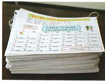
提出された散歩カレンダー 総数 810枚 カレンダーに は通し番号を付けて50枚ずつ リングで束ねています。

昨年11月「散歩で健康大作戦」期間を設けました。歩いた時間を散歩カレンダーに記入して足腰の健康維持に努めました。この努力は抽選会で景品をゲットできるという「ごほうび」付きです。参加の皆様ありがとうございます。抽選会は1月13日に行いました。