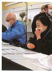
当たった番号のカ レンダーを選びま す。