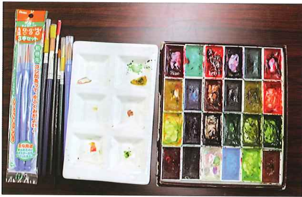
絵筆 パレット 絵の具を使います