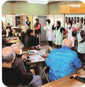
担当の方から挨拶と作り方の説明