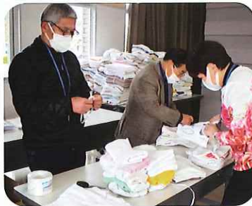
寄せられたぞうきんは数えやすく配りやすくするために50枚ずつ束ねます。

今年度も12月までに各単位クラブから合計1817枚のぞうきんと199,013円のボランティア募金が寄せられました。ご協力ありがとうございました。