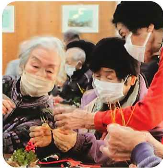
作り方が分からなくてすぐ教えられる。

翌日24日オレンジカフェ見学に伺いました。受付で100円支払って参加します。当日は「正月飾りを作る」ことが計画されていました。役員さんが事前に準備したものを組み立てて作品が出来上がります。