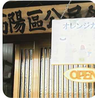
西高陽公民館の架けられたオレンジカフェの案内板