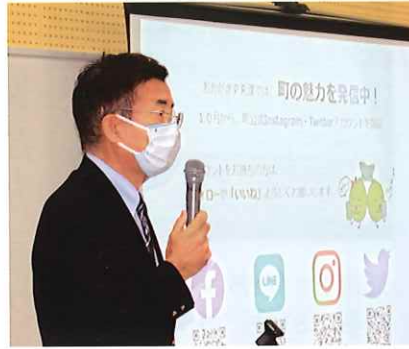
岡垣町は住みよい町ランキングでは上位にあると語る町長

今年も11月22日に女性リーダー研修会で門司町長による「岡垣町のまちづくり」と題した講演会が実施されました。 今年度、町役場に「おかがきPR課」が設けられました。町長のお話では岡垣町への観光や企業誘致活動を町外にむけてPR活動を強化するために設置されたことと、その成果は徐々に表れており、岡垣のやわらかでおいしい地下水を活用したワイナリーや