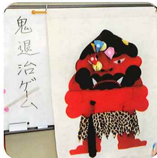
1月28日のオレンジカフェ「パル」は「鬼退治ゲーム」