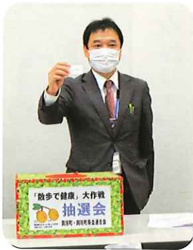
1等5本を引く長寿あ んしん課 船倉課長 (町長の代理)