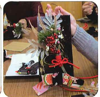
役員さんが用意したものを組み立てて正月飾りの完成

年度当初の計画にしたがって活動が実行され会員のつながりも強いようです。そのきずなおかげで役員選挙もすんなり決まるとのことです。昨年実績で高齢者支援活動について、見守り対象者13人 支援者11人、支援回数延べ2492回。下校時の子ども見守り活動にも延べ106人の方が参加しています。