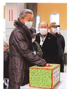
単位クラブの会 長は交代しながら 4等賞70本を引き ます。

毎日散歩の目的の一つは外の新鮮な空気を吸うことだと思っています。もう一つは脚の力を衰えさせないことです。私は、押し車(歩行補助具)を使って車の少ない近所を15分以上は散歩するように心がけています。現在足腰が弱り、耳の聞こえに支障があります。しかし、見る力、話す力が弱っていないのは幸いです。