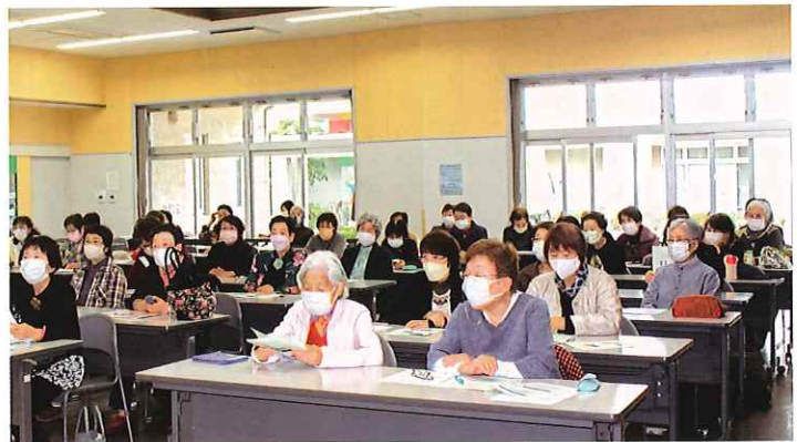
女性リーダー研修会 2022. 11. 22 いこいの里