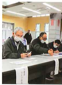
カードを照合し当 選者カードに記載 します。