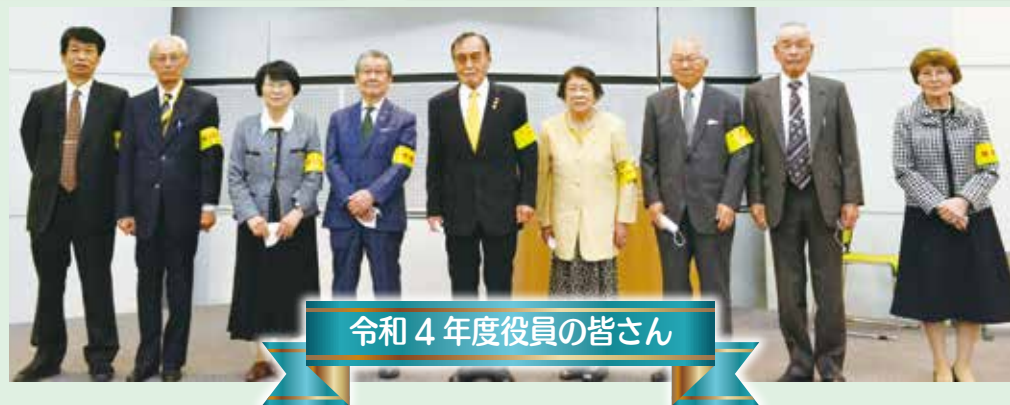
令和4年度役員 of 皆さん

4月22日(金)、大野城市まどかぴあ多目的ホールにて令和4年度通常総会を開催しました。議事では、第1号議案の令和3年度の事業報告から第6号議案の令和4年度の収支予算まで審議が行われ、原案通りにすべて可決されました。