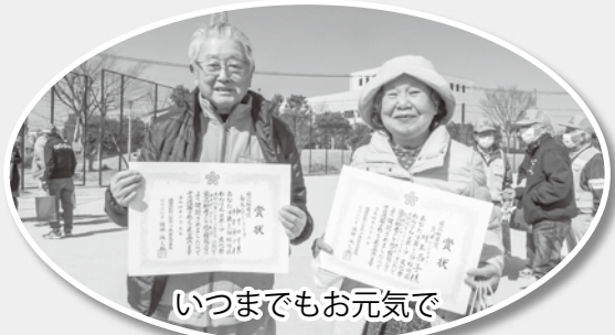
いつまでもお元気で