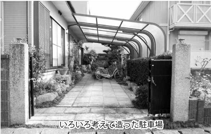
いろいろ考えて造った駐車場

以来、交通事故の報道を見た、胸が痛んだ。自動車運転免許を生涯、取得しまいとさえ考えた。とは言え車社会。職場の上司の勧めもあつて昭和61年に