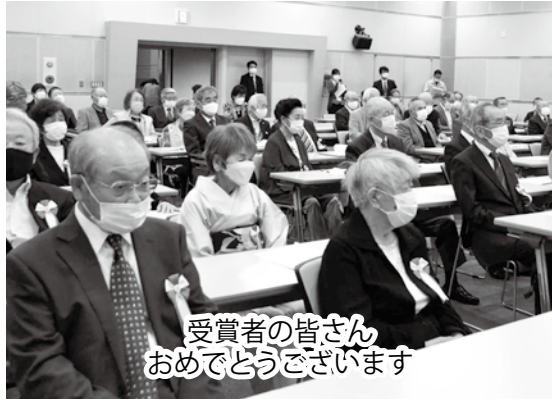
受賞者の皆さん おめでとうございます