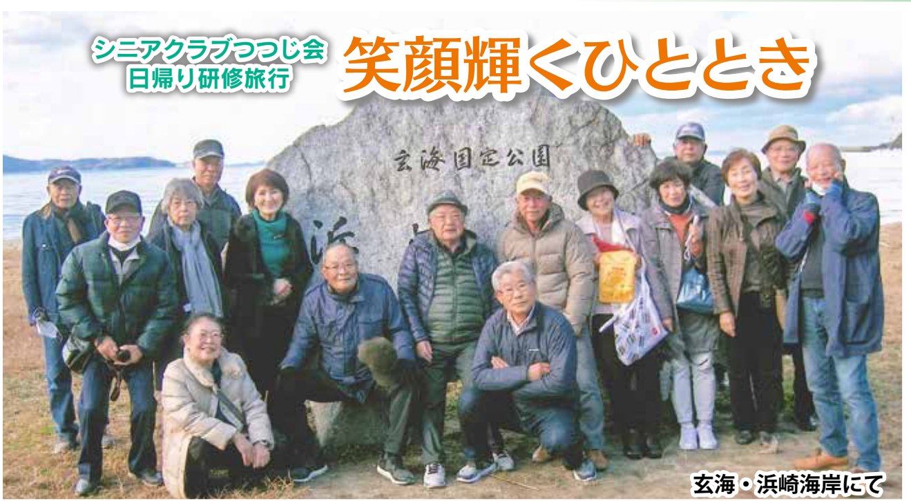
玄海・浜崎海岸にて

コロナ禍で活動を自粛していましたが、12月7日（火）に日帰り研修旅行を実施しました。久しぶりの仲間との再会を喜び合い、当日は豪華な食事に舌鼓を打ち、楽しい時間を過ごすことができました。