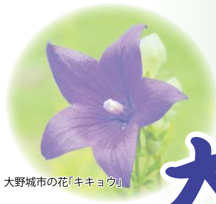
大野城市の花「キキョウ」