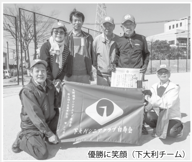
優勝に笑顔 (下大利チーム)