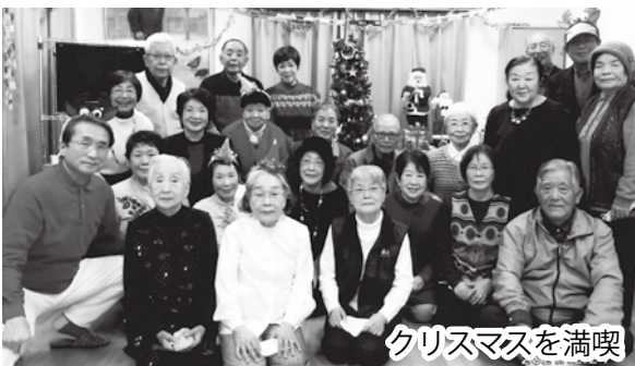
クリスマスを満喫

また、奇数月の月は日本古来の行事に幼い頃の思い出を託し、昨年7月は「七夕まつり」