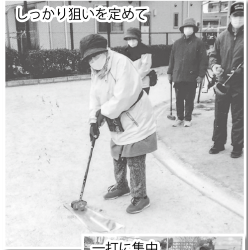
しっかり狙いを定めて

グラウンド・ゴルフを始める前に朝8時頃より場内清掃、設営をし、8時30分スタート、10時30分前後に終了する強行日