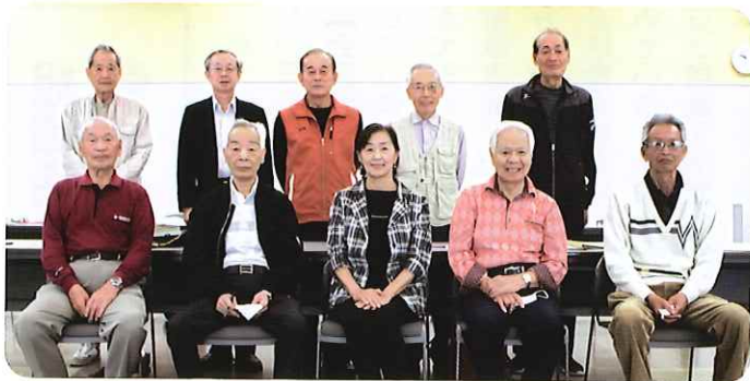
令和5年4月26日 いこいの里会議室で新任会長研修会が行われました。前列新任単位クラブ会長、後列連合会役員