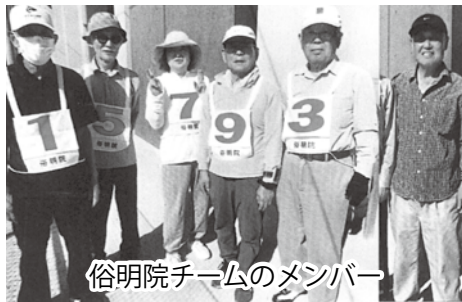
俗明院チームのメンバー

はできない状態ですが、今でも3クラブは活動されています。他のクラブでもゲートボールを始めていただければと思います「椿山」に投稿いたしました。