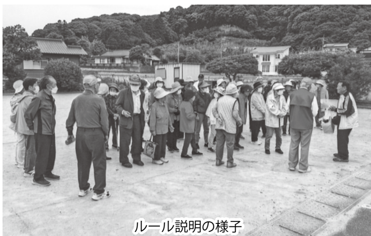
ルール説明の様子

令和7年8月28日（木）午前8時30分から、御笠コミセングラウンドにて御笠シニアクラブ連合会秋季ペタंक大会を開催しました。真夏の暑い中で、熱中症も心配されましたが10チームの参加で開催されました。上位5チームが市シニア連ペタंक大会に参加できます。