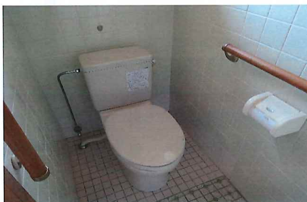
カラオケやCDプレイヤー等(会員)、G・Gのゴール(自作)、ペタンクコート設置