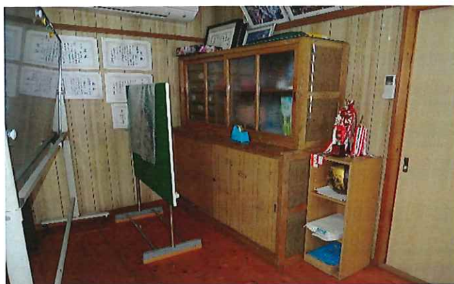
④ トイレの改修(業者)、体育等収納倉庫(設計～建築)(地域の人材)