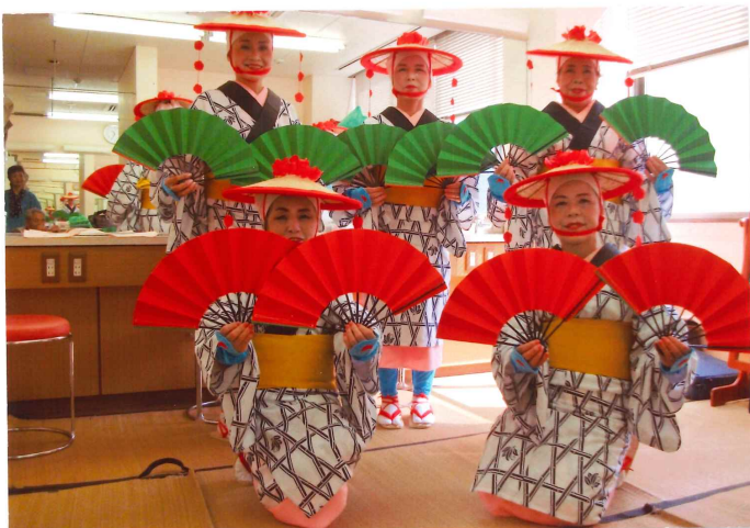
▶年次大会、敬老会での踊り