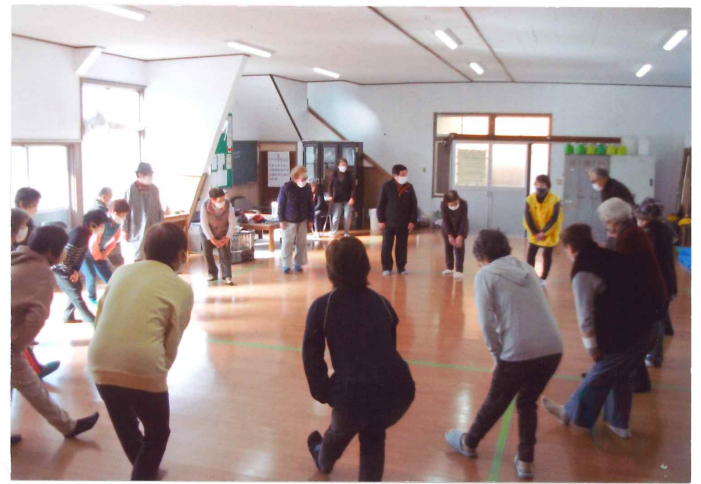
▶京町公民館室内にて、ペタンク競技前の準備体操