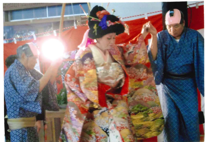
▶敬老会で「おいらん」を披露