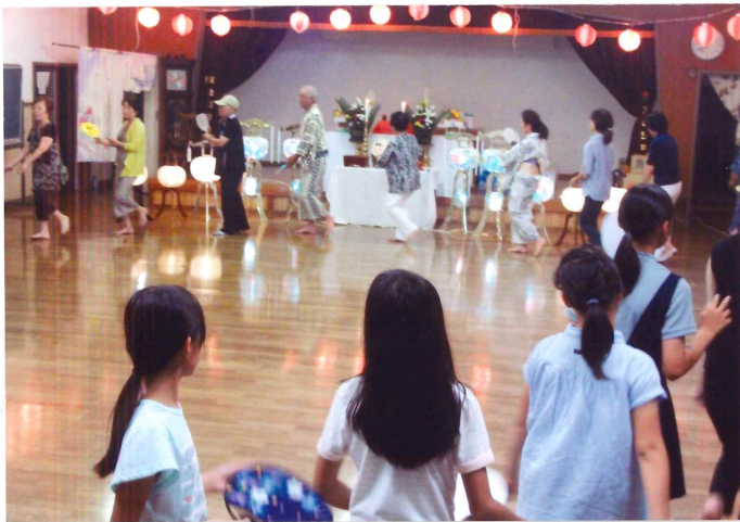
▶区のお地蔵さん祭りにて盆踊り いつもは外でやぐらを組んで踊ってます。